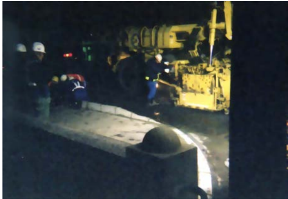
アスファルト切削状況