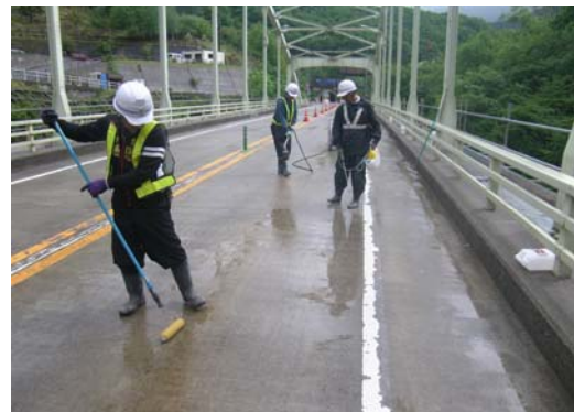
CS-21 塗布状況（床版上面）