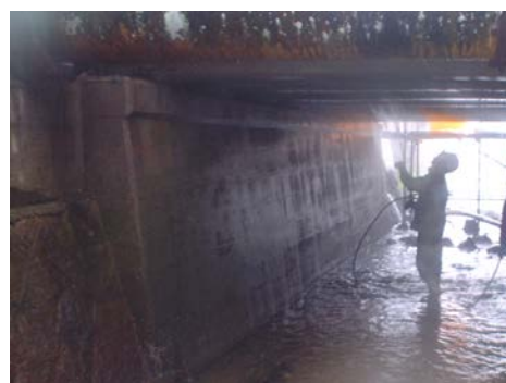
T1号橋 高圧洗浄状況