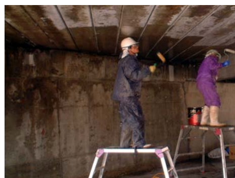
S橋 CS-21 塗布状況