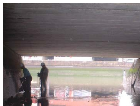
T3号橋 高圧洗浄状況