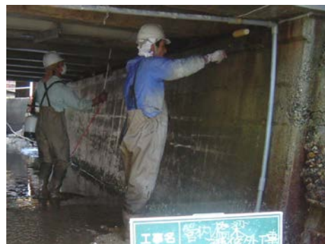
Y橋 CS-21 塗布状況