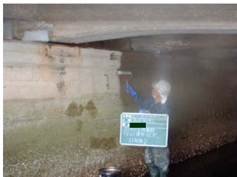
M橋 CS-21 塗布状況

国道事務所管内の橋梁補修工事において、水および劣化因子の侵入を抑制し耐久性を向上させる表面保護工としてCS-21が採用され、CSⅡ工法にて施工を行った。海に近い一部の橋梁については潮間帯のため、干潮の時間にあわせて短時間で施工を行った。