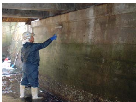
H橋 CS-21 塗布状況