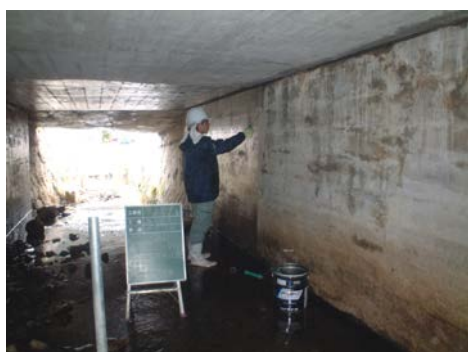
N橋 CS-21 塗布状況