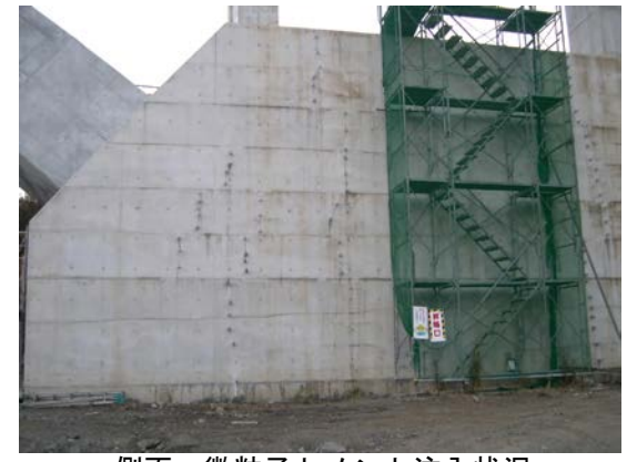
側面：微粒子セメント注入状況