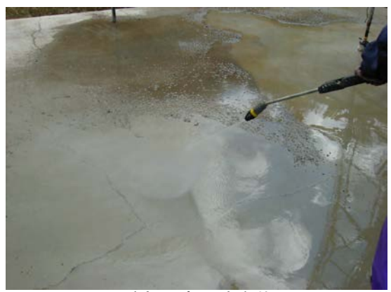
天端部：高圧洗浄状況