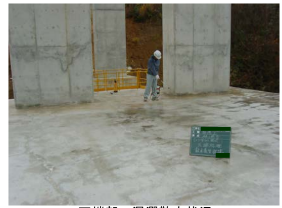
天端部：湿潤散水状況