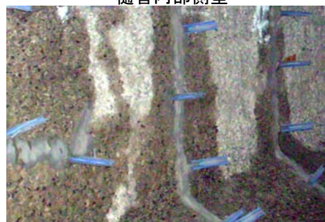
ひび割れ注入状況