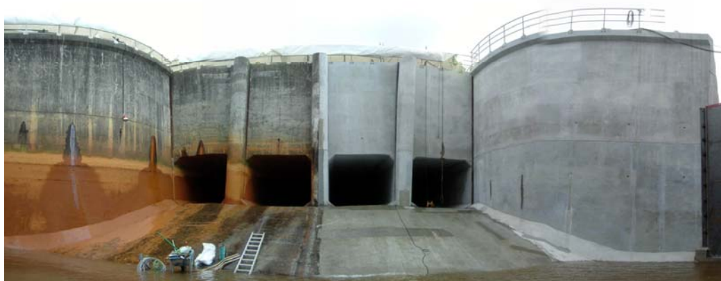
左側：施工前箇所 右：施工完了箇所