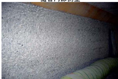
ハツリ工完了状況