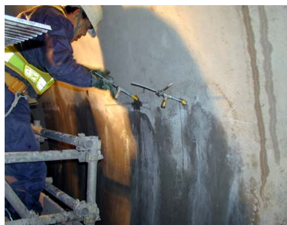
コールドジョイント部：注入準備状況