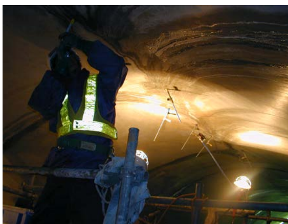
ひび割れ部：注入状況