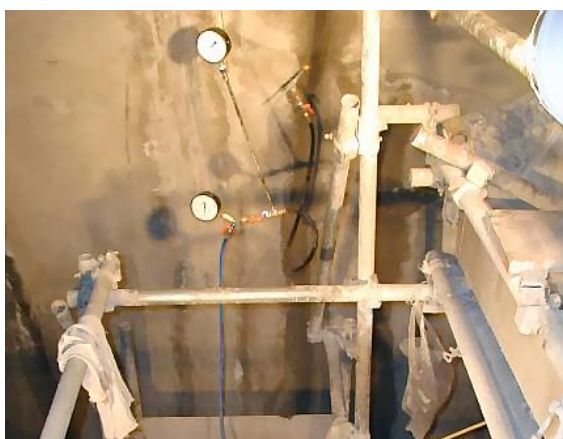
連続注入アタッチメントによる注入状況