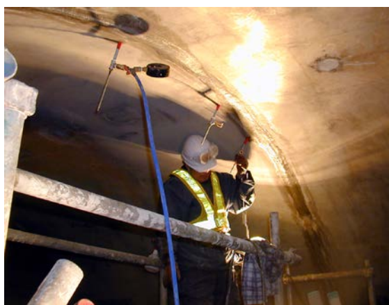
打継ぎ部：注入状況