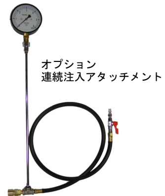
オプション 連続注入アタッチメント