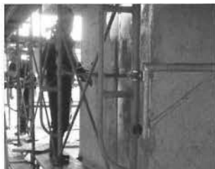
写真-2 材料散布状況