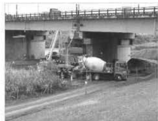
写真-1 巻立てコンクリート打設状況