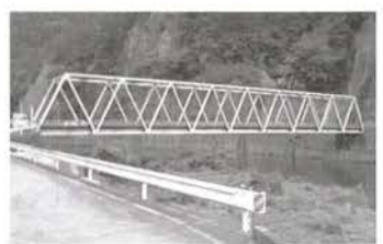
写真1 砂ヶ瀬橋全景

本工事は、広島県北西 部に位置する安芸太田町 の町道に架かる橋梁の補 修工事である。 当該橋梁は、竣工から 約40年が経過し、経年劣 化によりコンクリート部 材にひび割れなどが発生