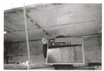
写真3 注入工法 シール状況

ンクリートのひび割れ調査、補修・補強指針-2009・2013-』、(公社)土木学会の『表面保護工法設計施工指針(案)』および『けい酸塩系表面含浸工法の設計施工指針(案)』に準拠し検討した結果、無機系注入工法と反応型けい酸塩系表面含浸工法が選定された。