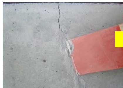
CSパテすり込み状況