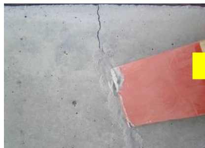
CSパテすり込み状況